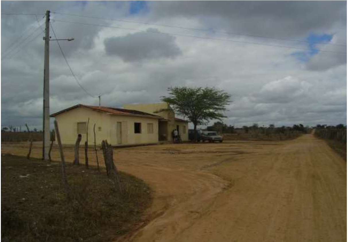
FOTO 03 - Escola municipal Justino Rêgo Soares do povoado Lajedo.