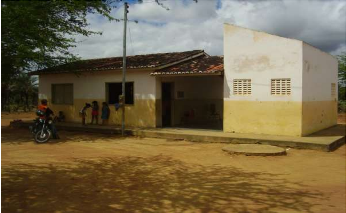
FOTO 01 - Escola municipal João Evangelista Filho do povoado Mata do Estado.