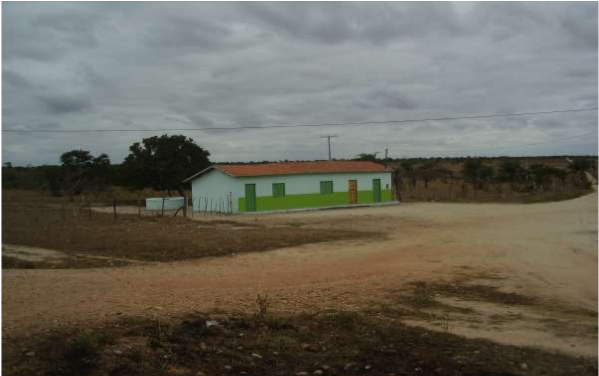
FOTO 02 - Escola municipal Luciano Silva do povoado km 12.