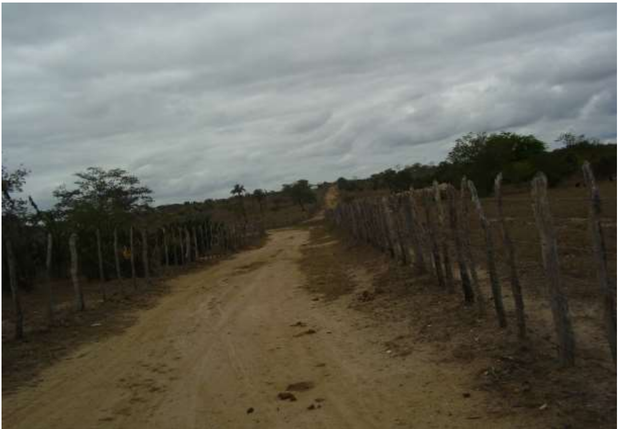
FOTO 04 – Estrada utilizada para chegar à escola municipal Justino Rêgo Soares do povoado Lajedo.